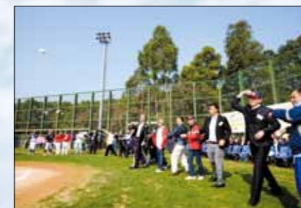
First Pitch by Officiating Guests