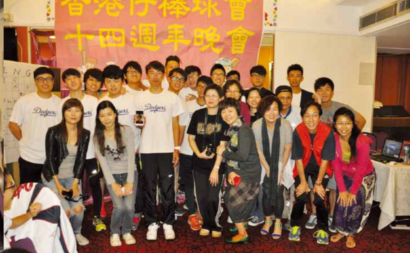
2012-13 Grade A Team