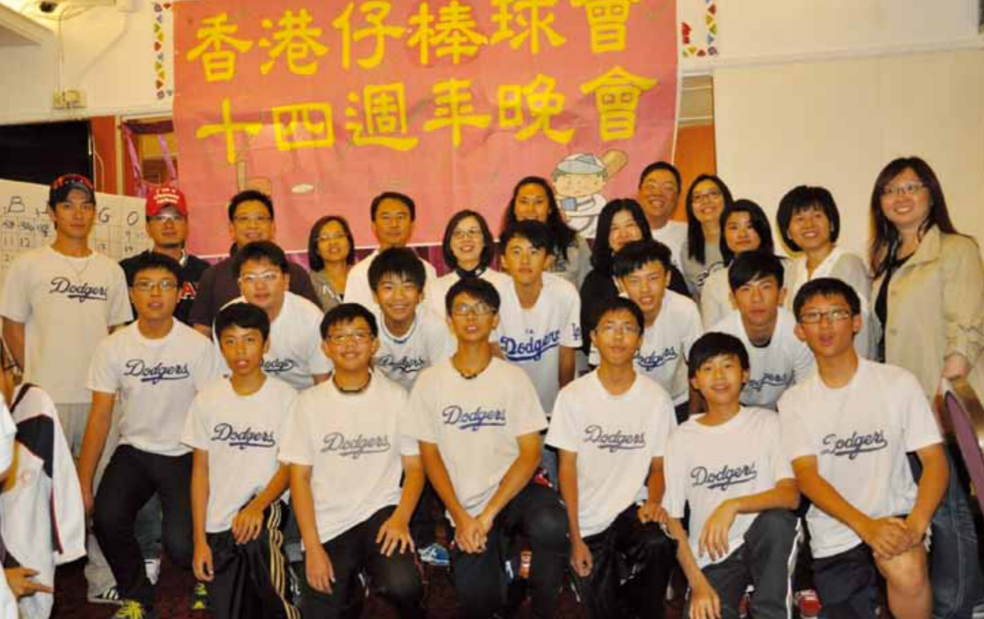
2012-13 Junior Team