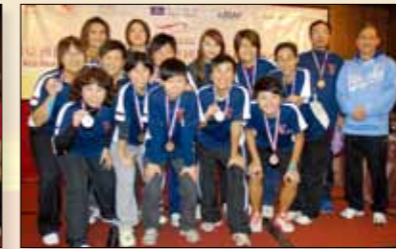
Taipei Vanguard Women's Baseball Team