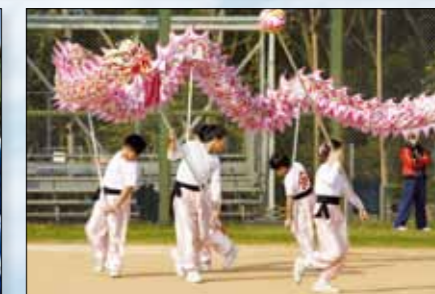
Performance by Dragon Dance Team of Sha Tin Wai Dr. Catherine F. Woo Memorial School