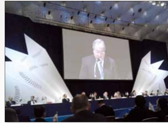
Speech by Mr. Sadaharu Oh