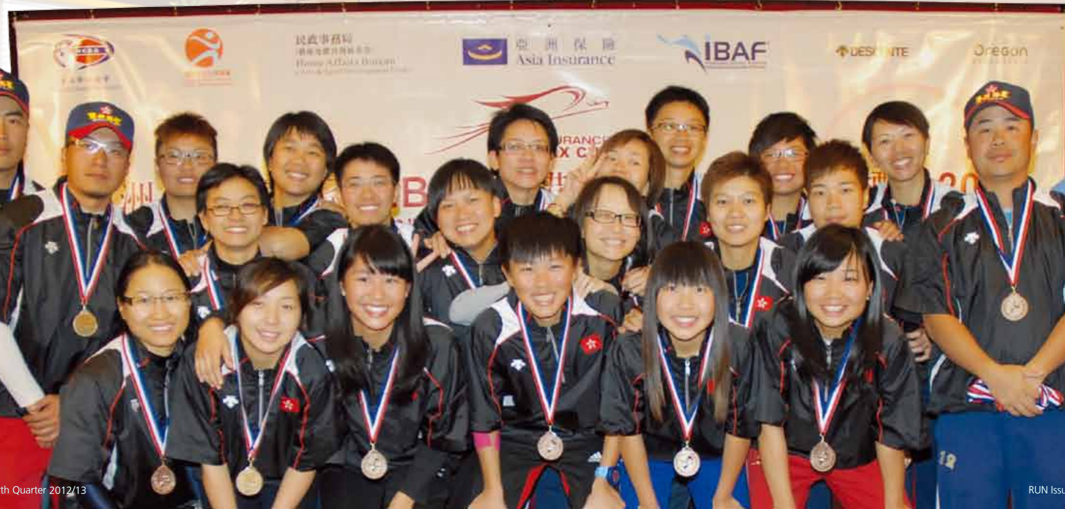
Hong Kong Allies