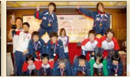
Far East Bloomers, Japan