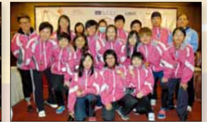
Hong Kong Development Team