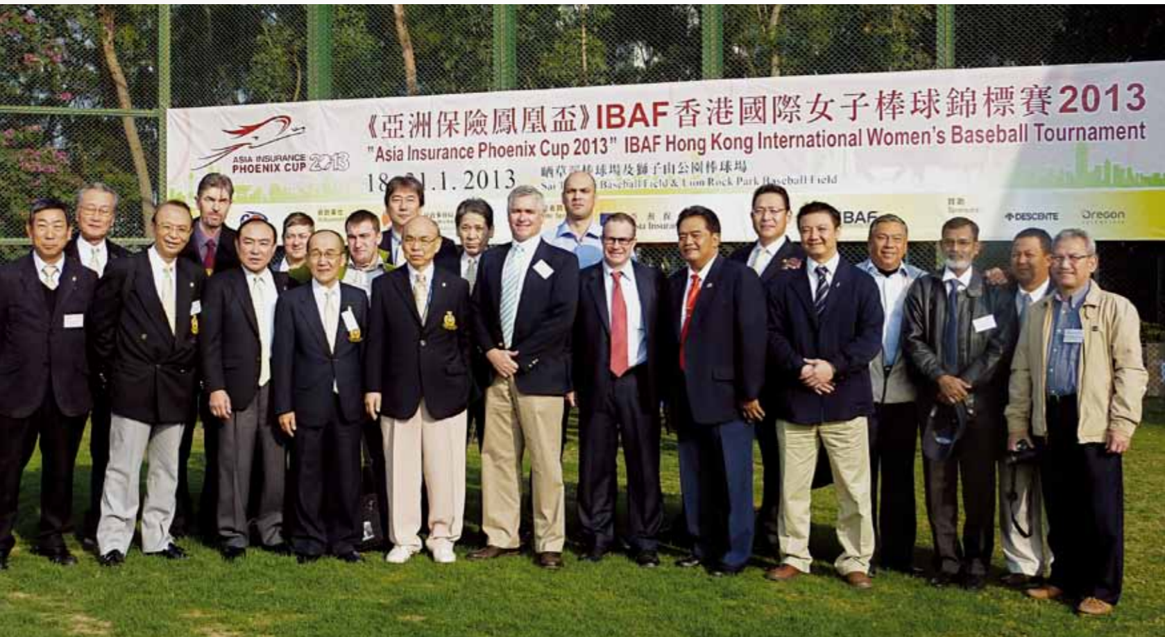
PONY Directors joined the opening ceremony