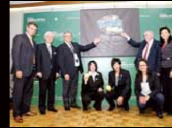
New Olympic Campaign Logo, Theme, Social Media Platforms "PlayBall2020.com" and Vision to Give Every Boy & Girl Chance to Play Ball also Launched.

The WBSC also outlined its unique vision for the campaign. "Our vision is to give every boy and girl in the world a chance to play baseball and softball and to inspire them to take up the sport through the Olympic Games," said ISF President and WBSC co-President, Don Porter.