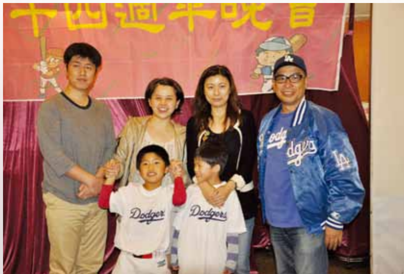
2012-13 T-Ball Team