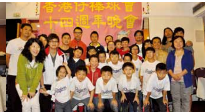
2012-13 Minor Team