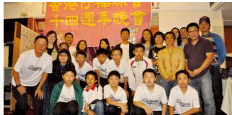
2012-13 Major Team