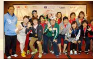
Guri-city NineVics Women's Baseball Team, Korea