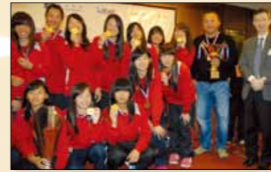
Shilin High School of Commerce, Taiwan